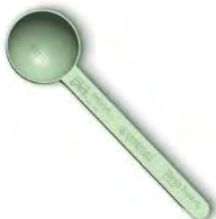
Colher-medida Sustentável p/ Beta heart e Rebuild Strength Cód. 1B42 1,02 €