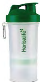
Super Shaker Cód. 8697 10,46€