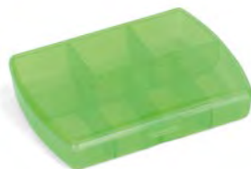
Caixa para Comprimidos Pequena Cód. A727 1,82 €