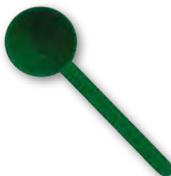
Colher-medida Sustentável para Fórmula 1 / Mistura para Bebida de Proteína Cód. 2B09 1,02 €