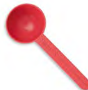
Colher-medida Sustentável para Night Mode e Collagen SKIN Booster Cód. 2B08 1,02 €